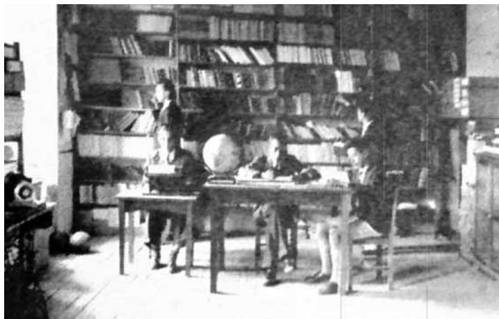
Biblioteca de la Escuela Normal de Occidente.